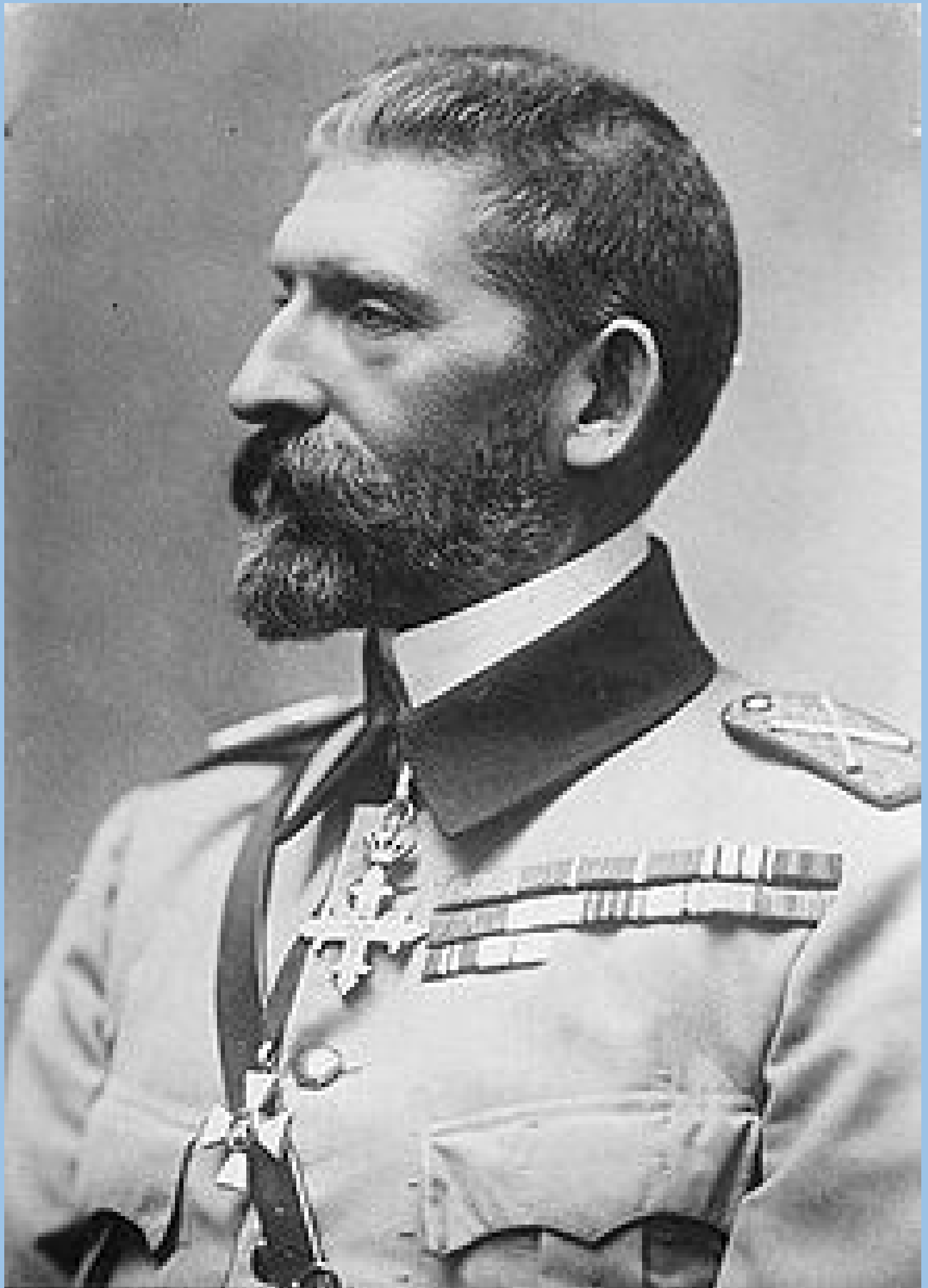
Regele Ferdinand I de Hohenzollern-Sigmaringen al României